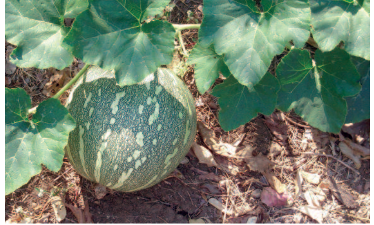
Las calabazas verdes son la segunda cosecha que los agricultores plantan para comer y sacar un rendimiento, entre temporada y temporada de arroz

Y añade: “Los agricultores ponen todo de su parte para que la empresa llegue a buen fin.”