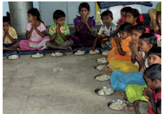
Niños preescolares en la localidad de Taluka Wada

es causa de muchas enfermedades. Implementar programas de nutrición es un paso muy importante para erradicar este problema.”