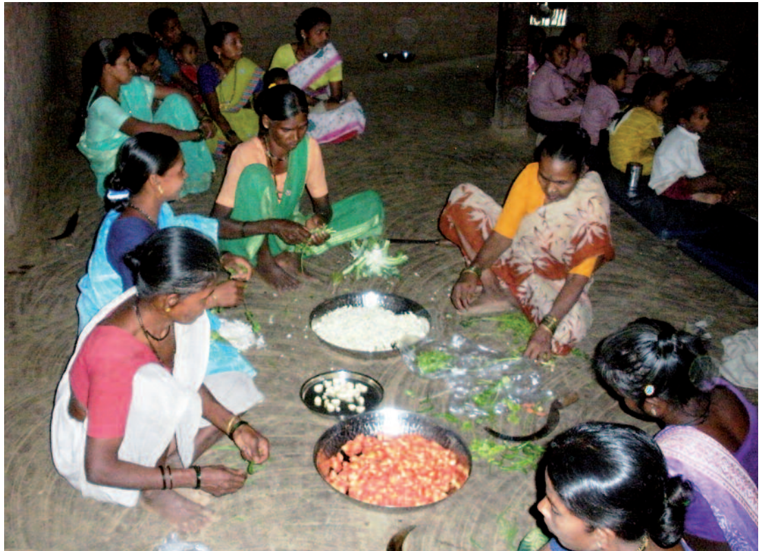
Gracias a Grupos de Autoayuda como éste, se sirven millares de comidas cada mes a niños desnutridos en el Valle de Tansa.

¿Cómo es posible para unos pocos grupos de mujeres, en un área remota, con pocos recursos y sin experiencia, preparar y distribuir 7.755 comidas para 285 niños en tan sólo 27 días?