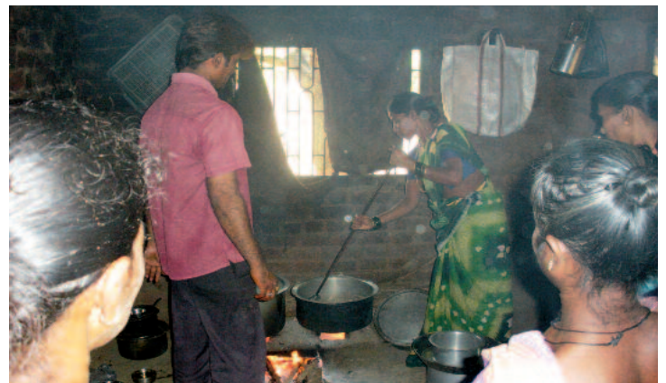
Un cocinero profesional enseña a las mujeres a preparar recetas nutritivas a gran escala