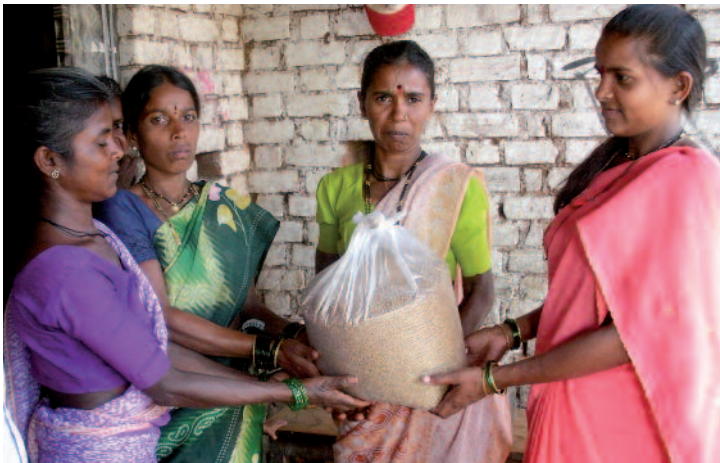
Para estas nuevas empresarias, una entrega de grano es muy bien recibida.

Las mujeres acarician la esperanza de tener éxito en reducir sustancialmente el índice de malnutrición entre los niños de sus áreas de servicio. A medida que ganan experiencia, se hacen más hábiles y crece su relación con otros Grupos de Autoayuda y miembros de sus comunidades. Empiezan a ver como sus Programas de Nutrición pueden llegar a ser entidades de autosustento tal como habían previsto al principio, lo que a su vez, puede conducir a otras oportunidades de generación de ingresos.