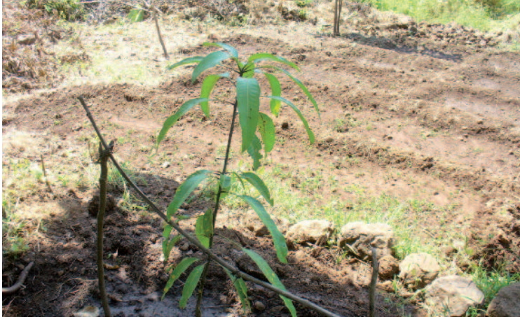
En unos años este árbol ofrecerá jugosos mangos